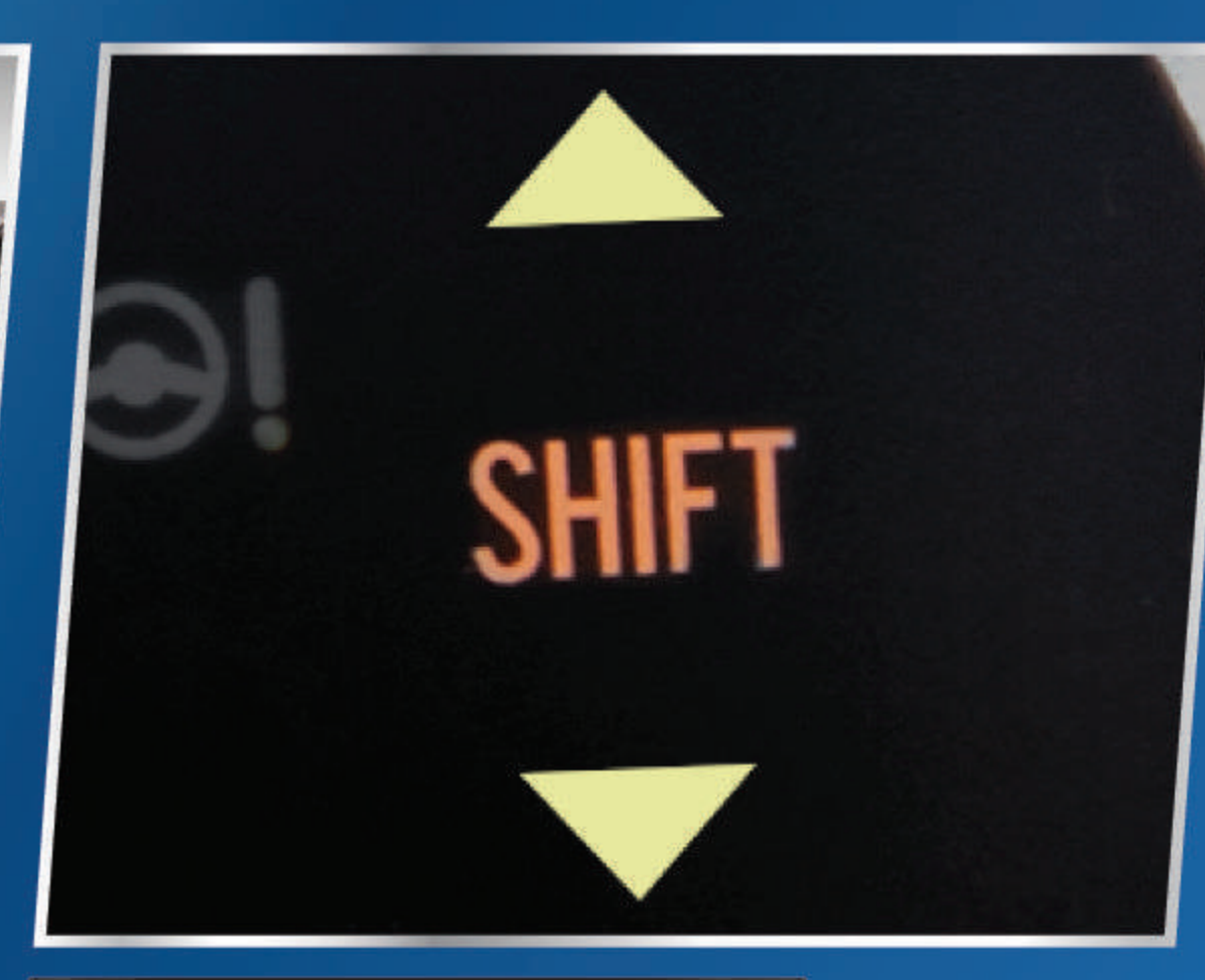
GEAR SHIFT INDICATOR

Kabin luas dengan tampilan dashboard modern yang memikat.