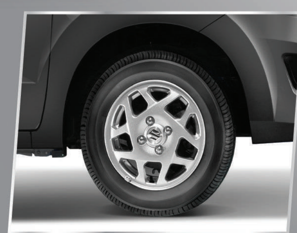
13" STAR SHAPE ALLOY WHEEL

Terlihat semakin elegan dengan logo S chrome.