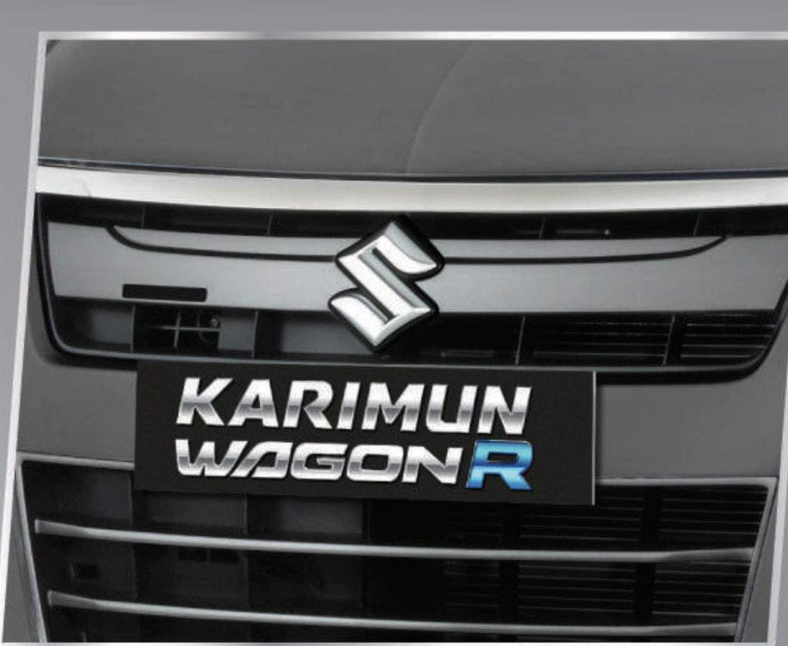
S LOGO ON THE GRILLE

Terlihat semakin elegan dengan logo S chrome.