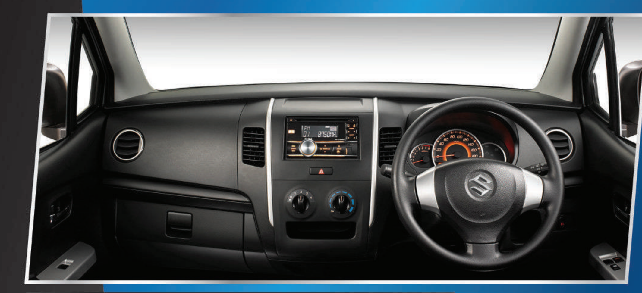
SPACIOUS CABIN WITH MODERN DASHBOARD

Power outlet serbaguna yang mudah dijangkau.