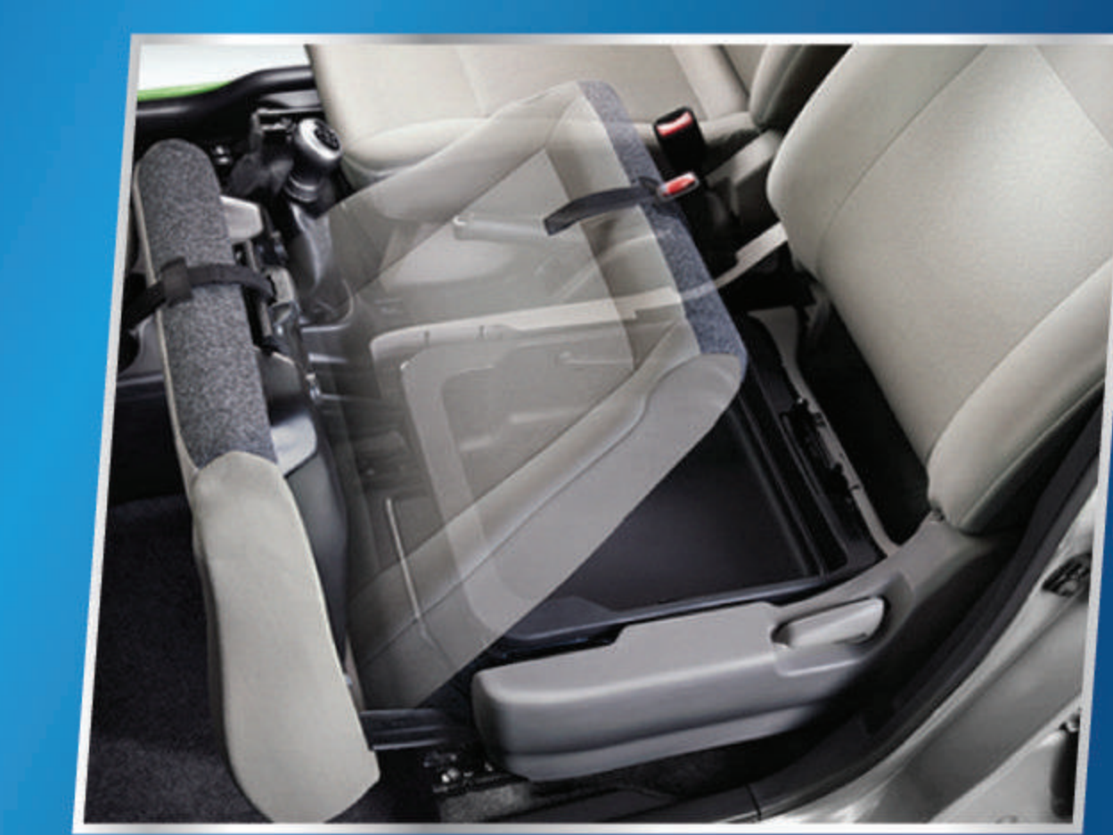
UNDER SEAT TRAY

Aliran udara dingin yang beriklan nyaman ke seluruh kabin.