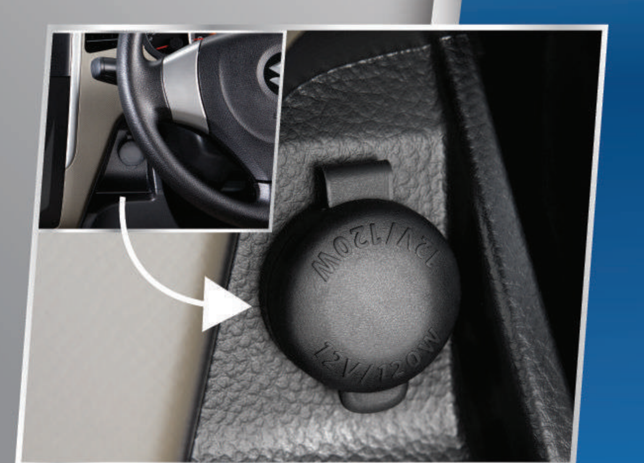
POWER OUTLET 12 V

Audio system baru yang menyatu dengan dashboard.