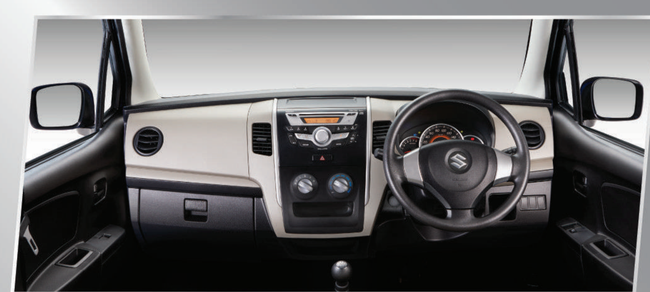
NEW COLOR GARNISH DASHBOARD

Dashboard dengan warna baru yang membuat kabin semakin nyaman dan elegan.