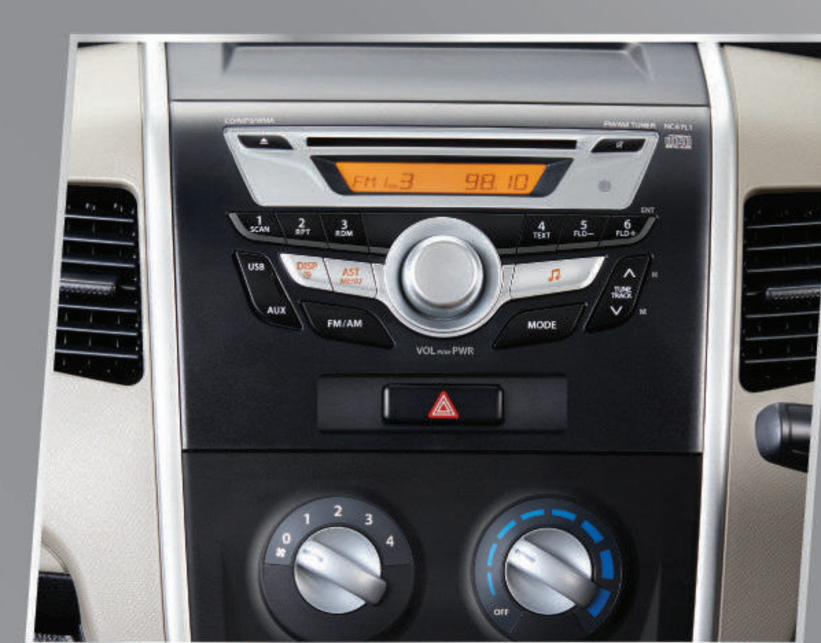
INTEGRATED AUDIO PANEL

Dashboard dengan warna baru yang membuat kabin semakin nyaman dan elegan.