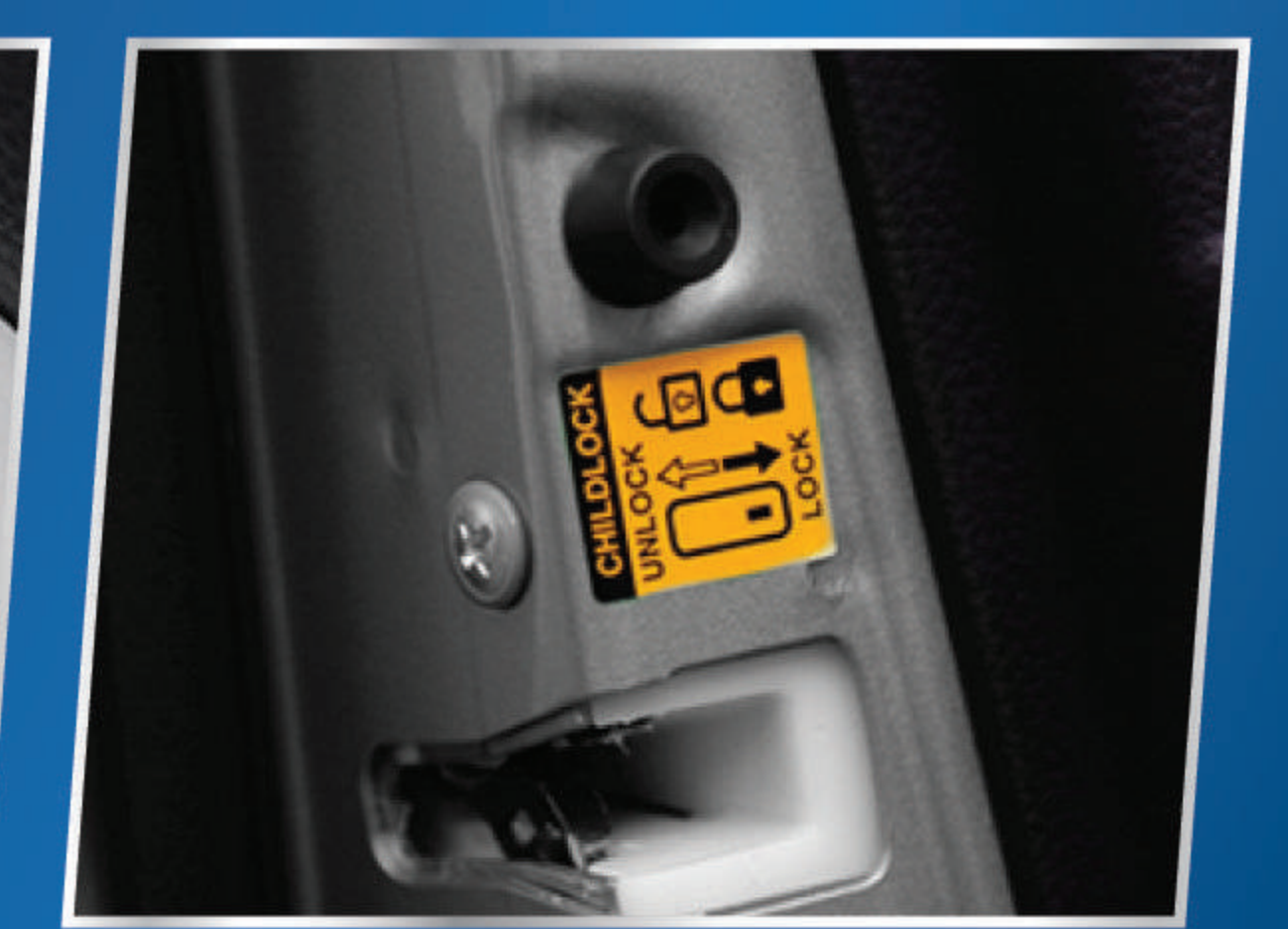
CHILD PROOF DOOR LOCK

Memberikan kemudahan untuk membuka jendela depan.